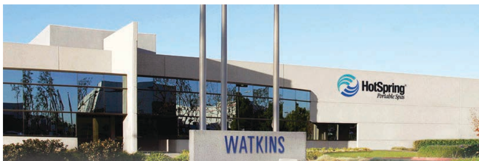
Fabricat de Watkins Manufacturing Corporation, Vista, CA, S.U.A.

2 ani garanție pentru sistemul de iluminare cu LED.