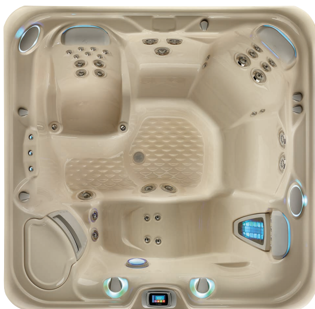
Modelul Envoy NXT cu cadă de culoare Creme