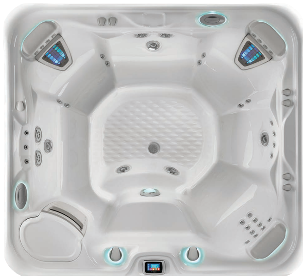
Modelul Grandee cu cada de culoare Alpine White