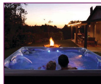
COLECȚIA HOT SPOT®