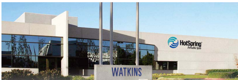
Fabricat de Watkins Manufacturing Corporation, Vista, CA, S.U.A.

2 ani garanție pentru sistemul de iluminare cu LED.