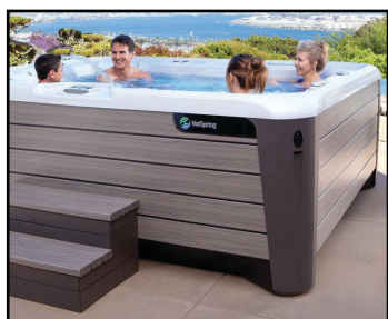
COLECȚIA HIGHLIFE® NXT